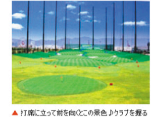
▲ 打席に立って前を向くとこの景色、クラブを握る前からのワクワクを教えてください。

上手いかわないどへこむ人もいるのですが(笑)、それでも打席で汗をかき一生懸命な姿を見ると、なんだか嬉しくなっちゃうんですね。