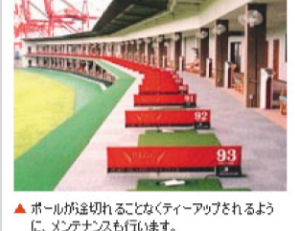
▲ ボールが空を切ることなくティーアップされるように、メンテナンスも行います。

最近のブームもあって大忙しの私たち。ゴルフを楽しむ方たちの裾野も拡がり、プレーヤーの地元で気軽に利用できる練習場のニーズが益々高まっています。ゴルフというスポーツがなくならない限り、私たちのノウハウと技術は必要とされ続けます。